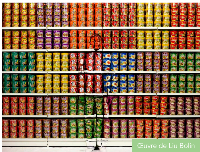
Œuvre de Liu Bolin

moyens physiques et psychiques. En accordant tout particulièrement du soin à l'alimentation.